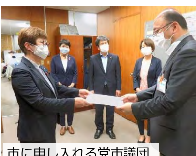
市に申し入れる党市議団

も、教員ともに大きな負 担となることが指摘さ れているものです。党市 議団は、全国学力テスト への不参加を市長、教育 長に申し入れました。