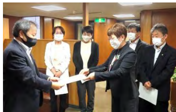
申し入れ書を提出する党市議団

党市議団は、さらに負担を 課し、市民の感染リスクを高 めかねない東京五輪と事前事 業の中止を国・県に求めるよ う、市に申し入れました。