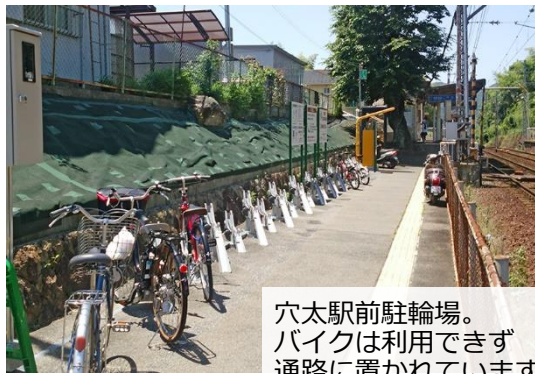
穴太駅前駐輪場。バイクは利用できず通路に置かれています

土地を借りて運営していた松ノ馬場、穴太、近江神宮、石場の各駅にある駐輪場が、4月から京阪電車に土地が返還され、京阪が委託する業者の運営に変わりました。これにより、利用料金が無料から1回100円になり、バイクは止められなくなりました。