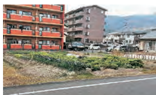
住宅に囲まれた農地

「今年の夏の暑さでトマトが全滅した」という声がありました。気候危機は農業生産にも影響し、今年の米の生産は例年の8割といわれています。さらに、大津市の農業就業人口は5年間で40%減少、市街化区域の農地も30%も減っています。特に地価が上がっている市街化区域は、固定資産税や相続税の負担が重く、農地の住宅化が広がっています。この問題の解決の一つに生産緑地制度があります。市が生産緑地と指定すれば、宅地並み課税の固定資産税を農地課税まで軽減できます。