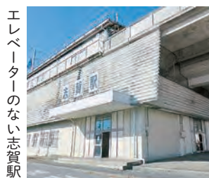
エレベーターのない志賀駅

その他の質問項目 ●PFAS（有機フッ素化合物）汚染対策 ●公共交通の確保、充実