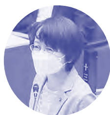
質問に立つ柏木市議

市は相次ぐ物価高騰で市民が大変な中、行革の一環として勤労福祉センターの体育施設(アリーナ、軽スポーツ室、トレーニングルーム)利用料の値上げ案を提出。日本共産党市議員団以外の賛成で可決されてしまいました。