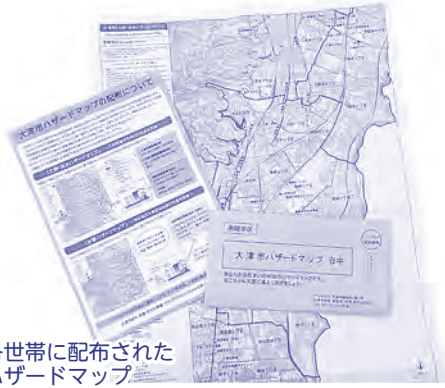
▲各世帯に配布されたハザードマップ