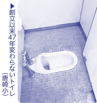
▶創立以来47年変わらないトイレ (唐崎小)

トイレに行くのを我慢する、ひどい臭いの中で勉強し、給食を食べるなど、古く汚いトイレが子どもたちの学校生活に悪影響を及ぼしています。市は改修を進めてはいますが、