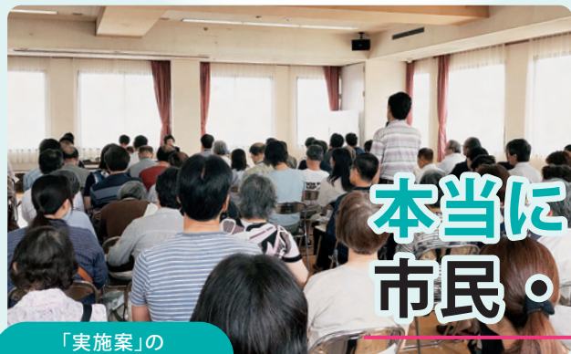
「実施案」の 学区説明会の様子

日本共産党市議団は、交通安全対策をはじめ市民の安全・安心な暮らしを守る市政を求め、6人で団結し6月通常会議に取り組みました。